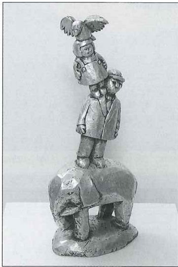
合唱団 / 1994年 / アルミニウム 42×17×12.5cm