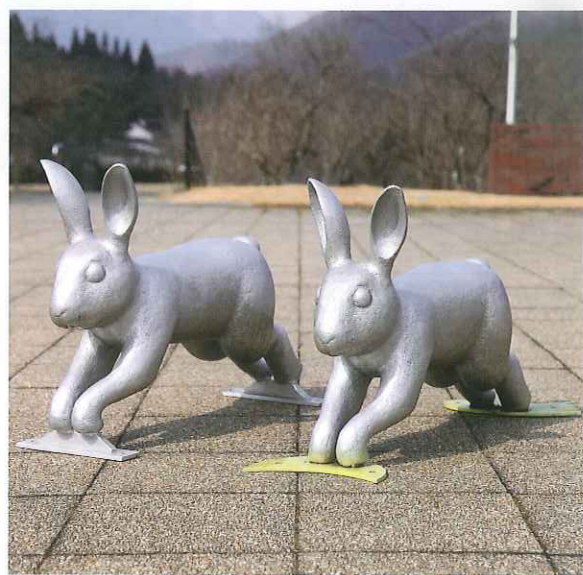
うさぎ／制作年不詳／アルミニウム／57×85×25cm