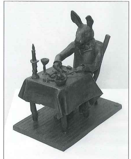
本日の夕食 / 制作年不詳 / ブロンズ 25×16×26cm

本展では、前回展で紹介できなかった未公開作品や、遺族の所蔵作品を展観し、業績を振り返り、顕彰します。