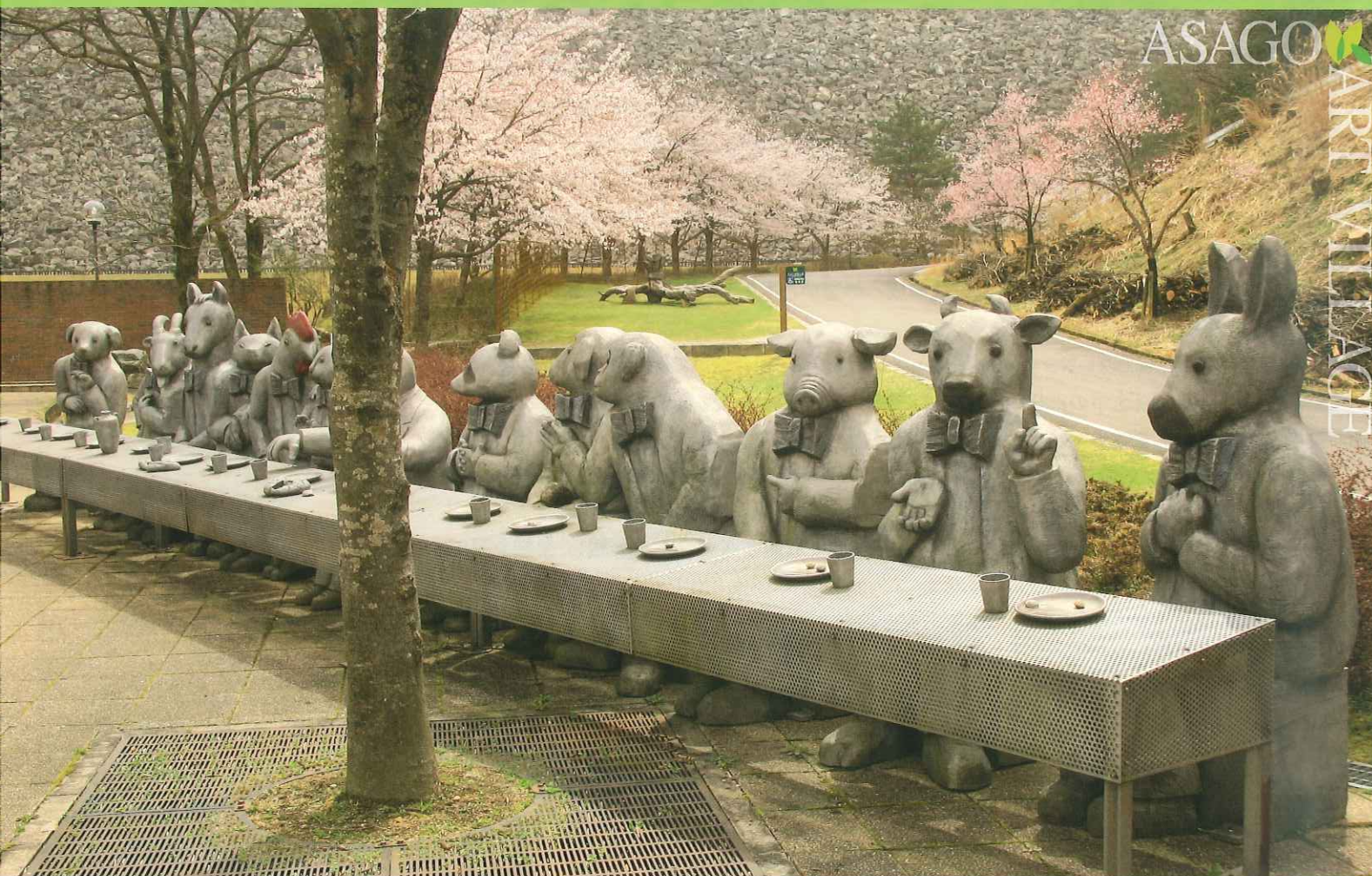
「最後の午餐」に集合した一同／1998年／アルミ・ステンレス／175×1145×125cm