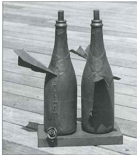
9月11日 / 2001年 / ブロンズ 19.5×26×35cm