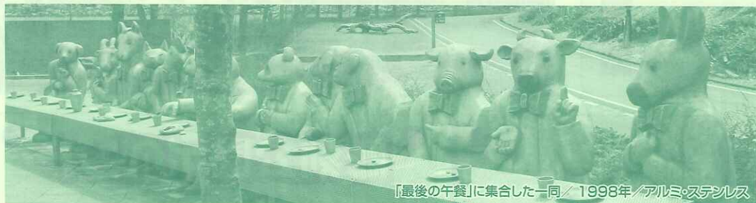
『最後の午餐』に集合した一同/1998年/アルミ・ステンレス

本展では、前回展で紹介できなかった未公開作品や、遺族の所蔵作品を展覧し、業績を振り返り、顕彰します。