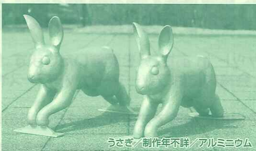
うさぎ/制作年不詳/アルミニウム

※ただし5月22日(日)は「芸術村とフリーマーケット」開催に伴い無料で入館できます。