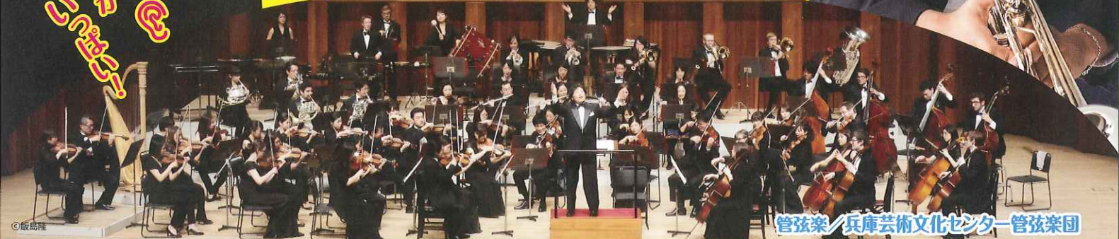
管弦楽/兵庫芸術文化センター管弦楽団

2017. 3/20 (月・祝) 開演2:00PM(開場1:30PM) 一般: 1,500円 小学生以下: 500円(全席指定) ※3歳未満の入場不可