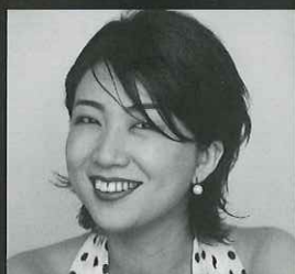
深川和美 (進行) Kazumi Fukagawa, MC

1981年ベネズエラ生まれ。8歳から父の手ほどきでトランペットを学ぶ。さらにフランスで名トランペット奏者、エリック・オビエの指導を受けた。2005年フィリップ・ジョーンズ国際トランペット・コンクール第1位、2006年モーリス・アンドレ国際トランペット・コンクール第1位および特別賞受賞、そして同年、イタリア・ボルチア国際トランペット・コンクール第1位を受賞。エル・システマ出身アーティストとして、シモン・ポリバル響、シモン・ポリバル金管五重奏団、そしてソリストとして来日した。日本では札幌、大阪フィル、東響、N響と共演しているほか、2011年には小澤征爾の招きでサイトウ・キネン・オーケストラの首席奏者を務めた。2013年、クリスティアン・パスケス指揮ベルリン・コンツェルトハウス管弦楽団とレコーディングを行い、DGLレーベルでデビューを果たした。