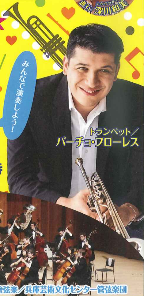
トランペット/ パーチョ・フローレス