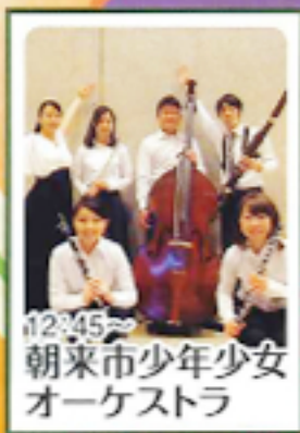
12:45~ 朝来市青少年 オーケストラ