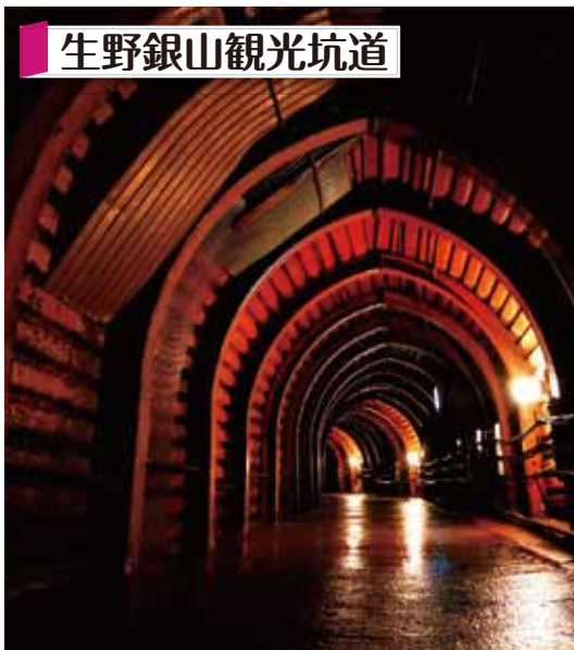
生野銀山観光坑道