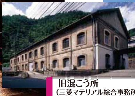
旧混こう所 (三菱マテリアル総合事務所)