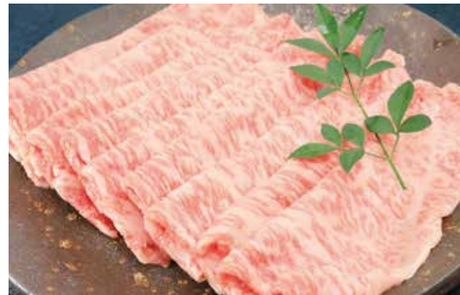
高級ブランド牛肉の素牛「但馬牛」