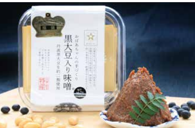
おばあちゃんの手づくり「黒大豆味入り味噌」