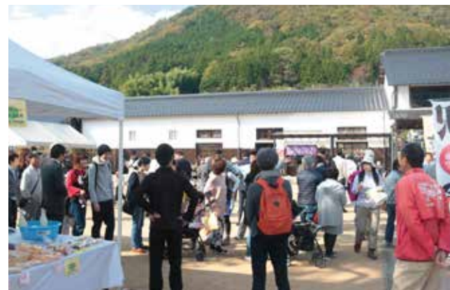
2017年イベント会場の様子