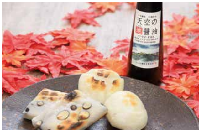
身体にやさしい「もち」・伝統の「お醤油」