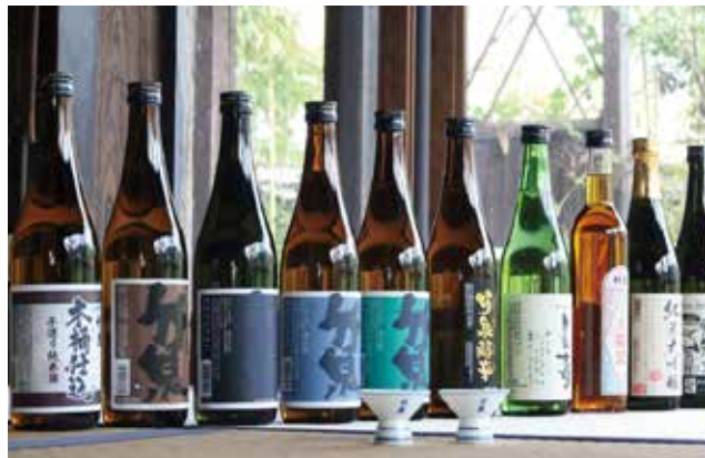
歴史ある酒蔵のこだわり「地酒」