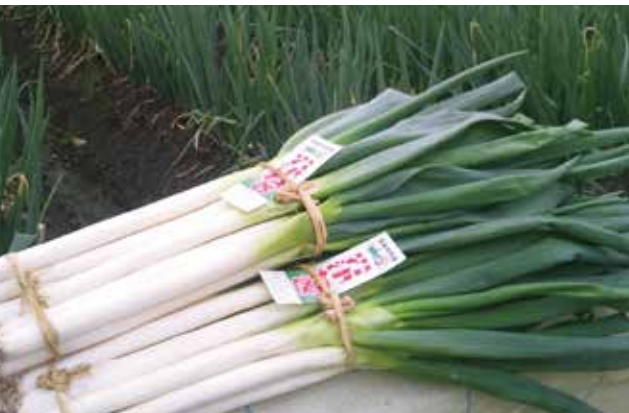
幻のねぎと言われる「岩津ねぎ」