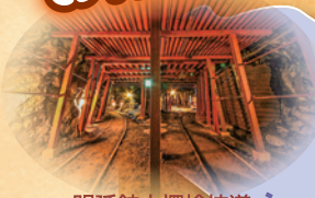
明延鉱山探検坑道