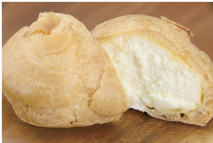
国産ハチミツ使用でまろやかな甘みに仕上げたシュークリーム