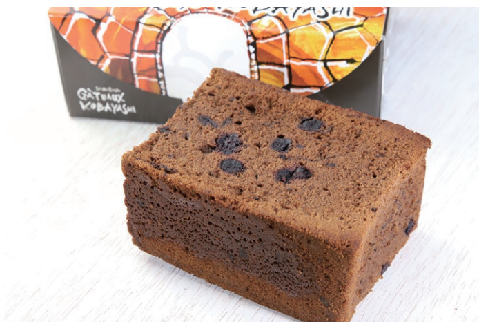
2015年度「銀の馬車道おやつコンテスト」優勝 カラミ石ケーキ