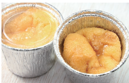
スフレ・フロマージュ