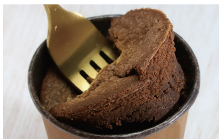
ガトー・ショコラ