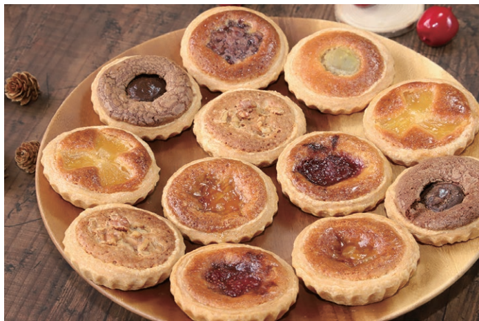
定番から季節の果物を使用したものまで豊富なミニタルト

季節の果実を自家製ジャムにして焼き上げた『タルトケーキ』や クリームたっぷりの『シュークリーム』 自家製生キャラメルを使用した『ちゃったプリン』をはじめ 当店オリジナルのスイーツをそろえて皆さまのご来店をお待ちしております