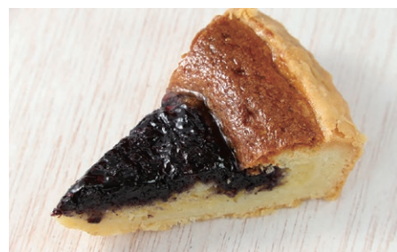
タルトホールはご予約必要 [5号: 15cm]

営業時間 9:00 ~ 18:00 定休日 不定休 住所 朝来市生野町口銀谷 2000-2 TEL / FAX 079-679-3752