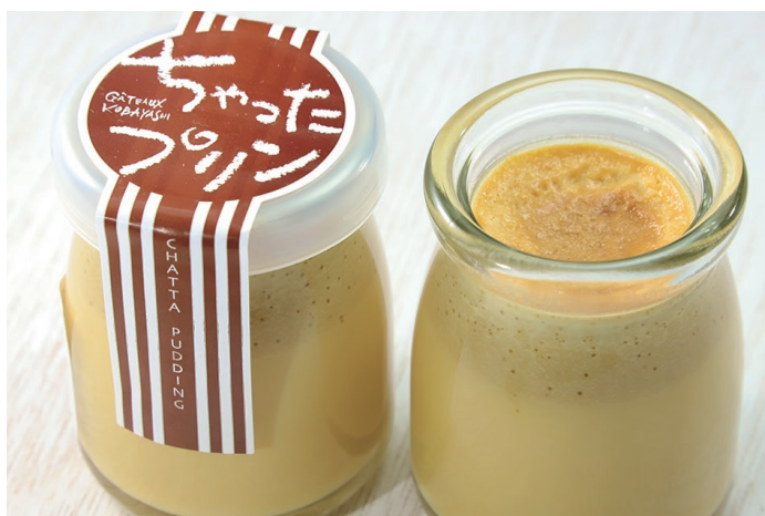
自家製生キャラメルを使用した ちゃったプリン