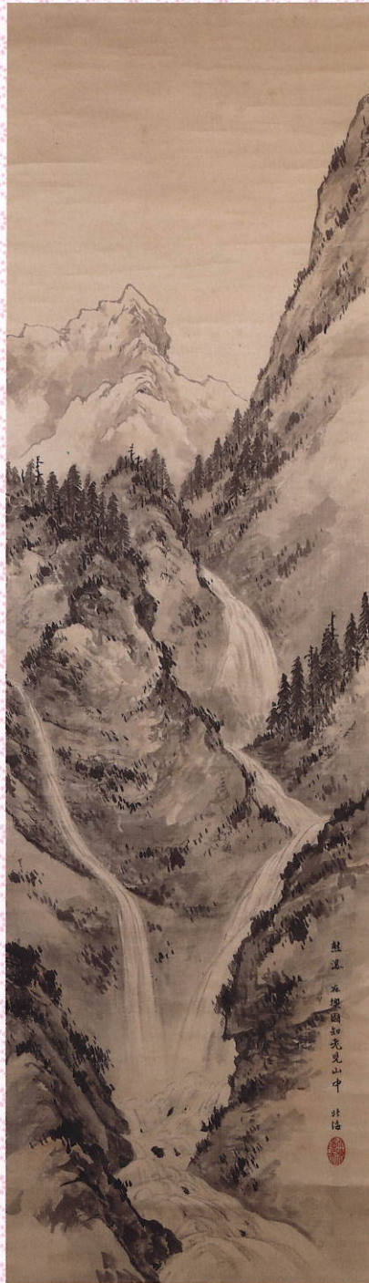
高島北海「水墨山水図」