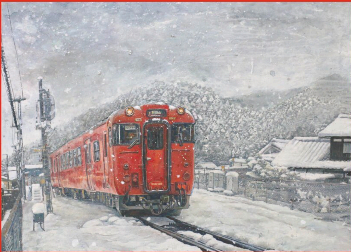
霏霏として雪が降る播但線 / 生野駅 松本知佳