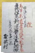
兵庫県立兵庫津ミュージアム