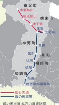
銀の馬車道 鉱石の道経路図