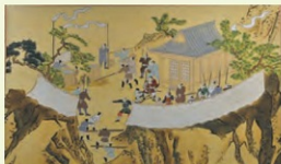
妙見山陣備への回(生野養華絵巻巻・生野書院所蔵)

兵庫県中央部の播但地域。そこに姫路・飾磨港から生野鉱山へと南北一直線に貫く道があります。「銀の馬車道」です。さらに明延鉱山、中瀬鉱山へと「鉱石の道」が続きます。わが国屈指の鉱山群をめざす全長73kmのこの道は、明治の面影を残す宿場町を経て鉱山まちへ、さらに歩を進めると各鉱山の静謐とした坑道にたどり着きます。この展覧会では、銀の馬車道 鉱石の道に関する新発見資料を含んだ関連資料を展示し、沿線の文化・鉱石の歴史をたどります。 ※会場規模によって展示品が異なります。