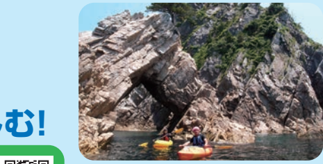
#岩美町立渚交流館 シュノーケリング&シーカヤック

3 浜坂駅 城山園地 ▶ 西へ1.5km 江戸時代には北前船の「風待ち・潮待ち港」として栄えた諸寄港が一望できる。ここから見える諸寄の美しい海と日本海に沈む夕日は絶景です。 山陰海岸ジオパーク館 ▶ 北へ1km 休 火曜日 9:00~17:00 TEL 0796-82-5222 ¥ 無料 ジオパークエリア内の玄武岩や安山岩、凝灰岩など多種多様な岩石を展示。さまざまな角度からジオパークについて学習できます。