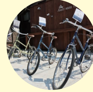
#市川沿いのトロッコ軌道跡

生野鉱山町の景観と町並み ▶ 1km 国の重要文化的景観に選定された「生野鉱山及び鉱山町の文化的景観」、志村喬記念館や生野まちづくり工房井筒屋など見所いっぱい。