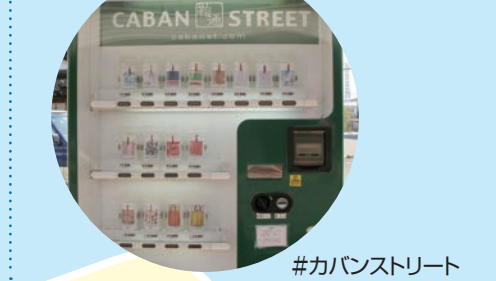
#カバンストリート

7 豊岡駅 コウノトリの郷公園・コウノトリ文化館 ▶ 東へ5km 休 月曜日(祝日なら翌日) 9:00~17:00 TEL 0796-23-7750 ¥ 無料 国の特別天然記念物コウノトリの観察ができます。 カバンストリート ▶ 東へ1km 「カバンのまち」豊岡の豊岡鞆やオリジナルデザインの鞆などのショップが並んでいます。