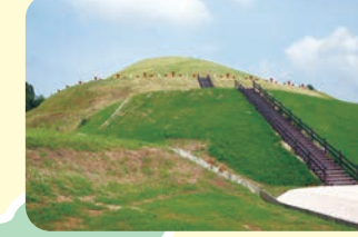
#茶すり山古墳公園・学習館

茶すり山古墳公園・学習館 ▶ 北東へ4km 休 月曜日 9:00~17:00 ¥ 無料 近畿地方最大規模の円墳である史跡茶すり山古墳。頂上に埴輪の復元レプリカが並び眺望も最高。