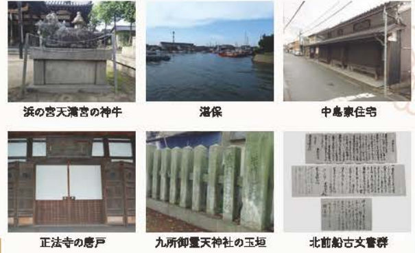
浜の宮天満宮の神牛

日本海や瀬戸内海沿岸には、山を風景の一部に取り込む港町が点々とみられます。そこには、港に通じる小路が随所に走り、通りには広大な商家や豪壮な船主屋敷が建っています。また、社寺には奉納された船の絵馬や模型が残り、京など遠方に起源がある祭礼が行われ、節回しの似た民謡が唄われています。これらの港町は、荒波を越え、動く総合商社として巨万の富を生み、各地に繁栄をもたらした北前船の寄港地・船主集落で、時を重ねて彩られた異空間として今も人々を惹きつけてやみません。