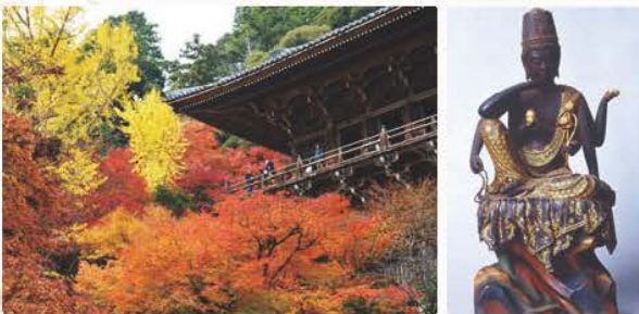
えんぎのじ ろっぴにいりんかんぞんぼつ 圓歌寺と六臂如意輪観世音菩薩

究極の終活とは、ただ死に向かって人生の整理をすることではありません。人生を通して、いかに充実した心の生活を送れるかを考えることが、日本人にとっての究極の終活です。そして、それを達成できるのが西国三十三所観音巡礼なのです。日本人は海外の人から「COOL!」だと言われます。そのように評価されるのは、優しさ・心遣い・勤勉さといった日本人の本来の心であり、実はそれは日本人が親しんできた「観音さん」の教えそのものです。観音を巡り日本人本来の豊かな心で生きるきっかけとなる旅、それが西国三十三所観音巡礼なのです。