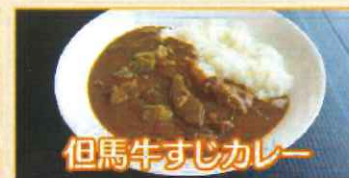
但馬牛すじカレー