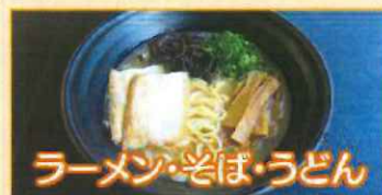
ラーメン・そば・うどん

定食各種 丼物各種 種類各種 カレー各種 全60のメニューは 季節によって 変わります。