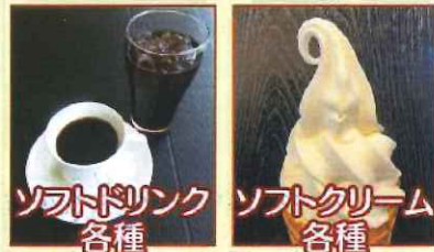
ソフトドリンク 各種